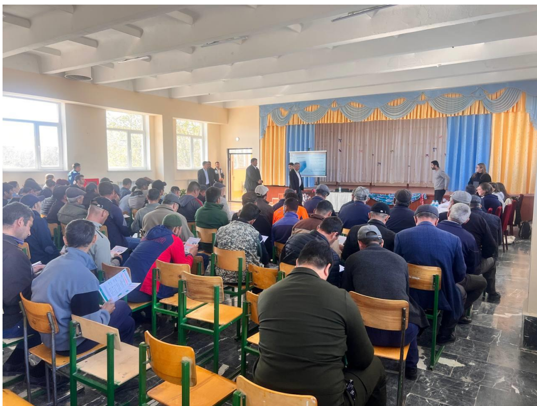
Рисунок 3: Фотографии встречи с общественностью, состоявшейся в Сарымае 9 ноября 2023 года.

Во время этого мероприятия WSP и ЕБРР имели возможность провести небольшую частную встречу с обоими махаллями и директором школы, чтобы узнать о впечатлениях от проекта, ожидаемых последствиях, любых опасениях, уроках, извлеченных из предыдущих проектов в этом районе, любых жалобах, возникших в результате других проектов в этом районе и притока рабочих и т.д. Они не