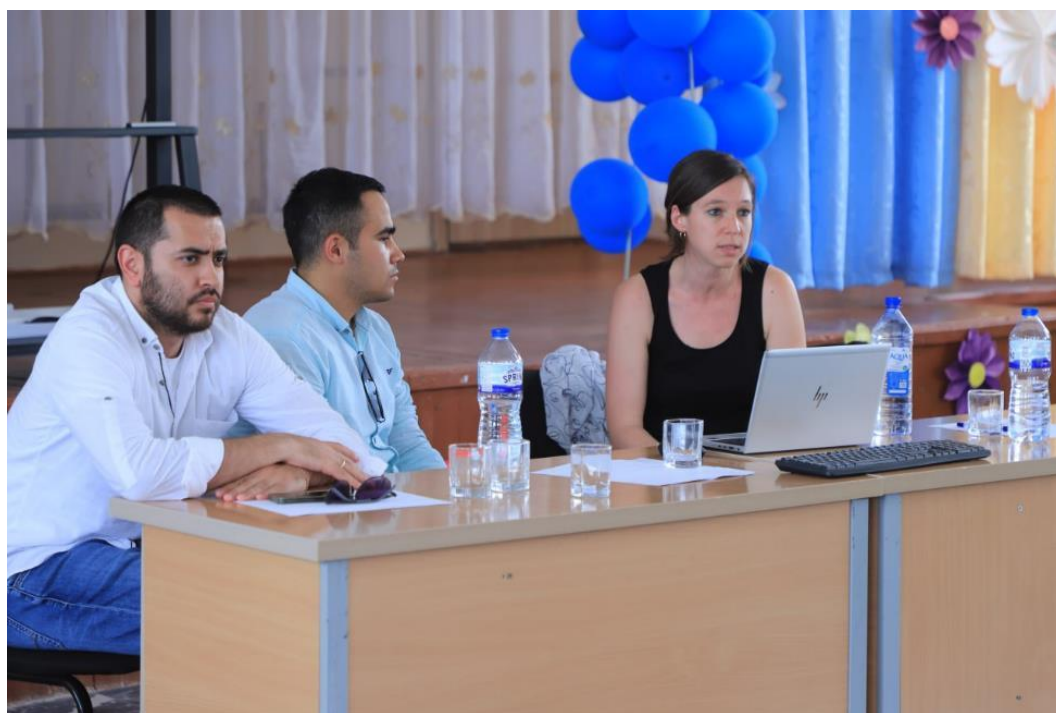
Рисунок 2: Фотографии встречи с общественностью, состоявшейся в Сарымае 7 июня 2023 года.