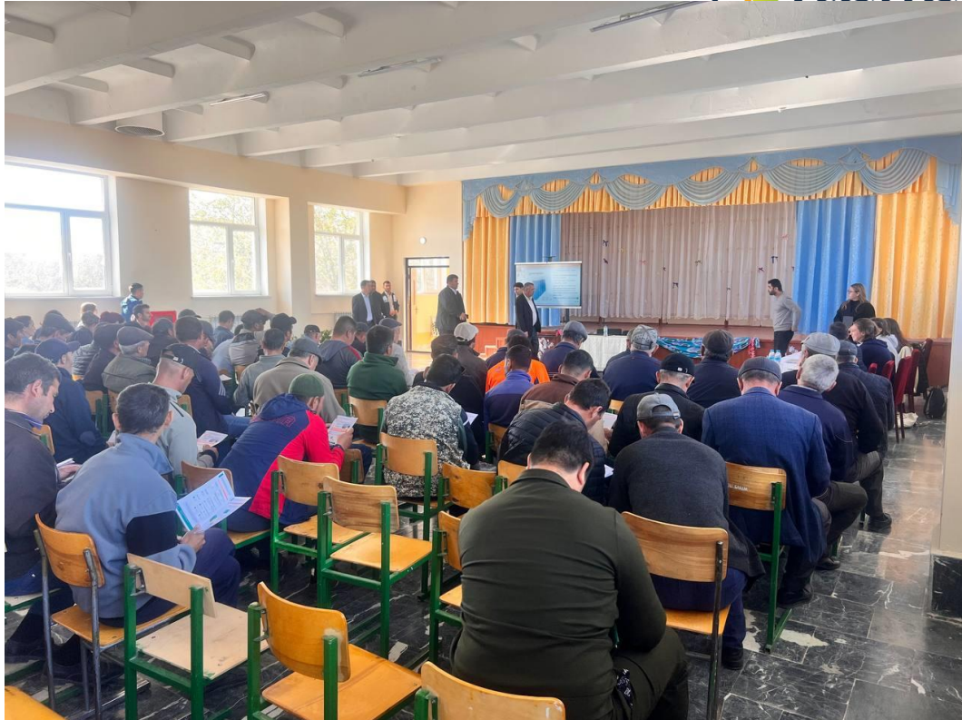
3-Расм: 2023 йил 9 ноябрда Саримайда бўлиб ўтган жамоатчилик билан бўлиб ўтган учрашувдан олинган фотосуратлар.

Ушбу тадбир давомида WSP ва ЕРТБ лойиҳа таассуротлари, кутилаётган таъсирлар, ҳар қандай ташвишлар, минтақадаги олдинги лойиҳалардан олинган сабоқлар, ҳудуддаги бошқа лойиҳалар амалга оширилиши ва ишчилар оқими натижасида юзага келадиган шикоятлар ҳақида эшитиш учун иккала ҳамжамият ва мактаб директори билан қисқа шахсий учрашув ўтказиш имконига эга бўлди. Улар аҳоли саломатлиги ва хавфсизлиги, экология, турмуш шароити ёки кўчирилиш жиҳатларига оид ҳеч қандай шикоят, танқид ёки хавотир билдиришмади. Уларнинг асосий ташвиши лойиҳа билан боғлиқ ишга жойлашиш имкониятлари билан боғлиқ эди. Маҳалланинг айтишича, маҳалла аъзолари ҳар куни ўз офисларига келиб, лойиҳа билан боғлиқ ишга жойлашиш имкониятларини билиб олишади. Кейин улар ишга жойлашиш имкониятига қизиққан номзодлар рўйхатини тузишни бошлаганликларини, бироқ шаҳар аҳолисининг кўпчилиги, жумладан, аёллар ва ёш авлод вакилларини қамраб олиш зарурлигини тушуниб, бу ғоядан воз кечишди.