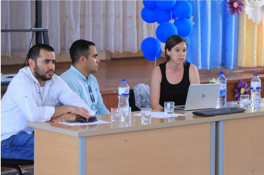
2-Расм: 2023 йил 7 июнда Саримайда бўлиб ўтган жамоатчилик билан учрашувдан олинган фотосуратлар .